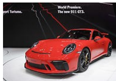
Las novedades del Salón del Auto de Ginebra 2017

EL INFORMADOR valora la expresión libre de los usuarios en el sitio web y redes sociales del medio, pero aclara que la responsabilidad de los comentarios se atribuye a cada autor, al tiempo que exhorta a una comunicación respetuosa.