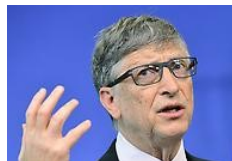
Las 10 personas más ricas del mundo en 2017