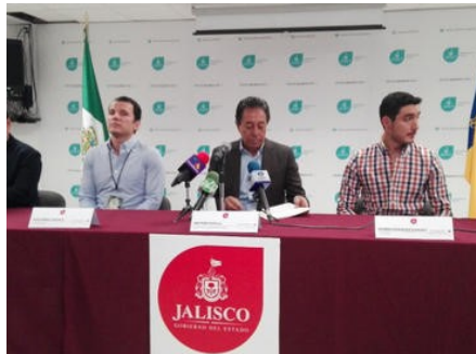
Padilla Gutiérrez dice que se han recibido demandas de compras de Japón, Corea del Sur, Singapur, China y Taiwán.

Economía Mexicana | Secretaría de Desarrollo Rural Jalisco | Economía local | Exportaciones