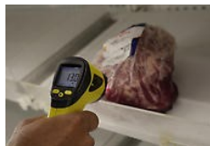
Crece bloqueo de países por carne 'maquillada' en Brasil